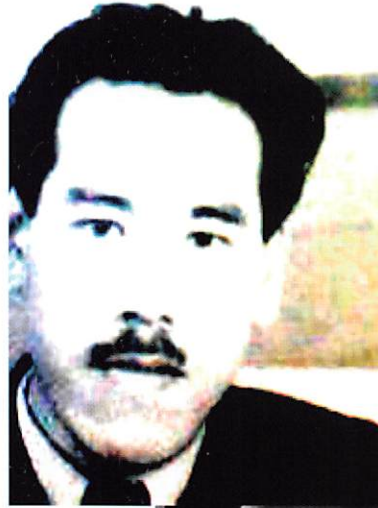
新渡戸稲造 水野広徳 伊丹万作 早坂 暁 大江健三郎 伊丹十三 木村真三