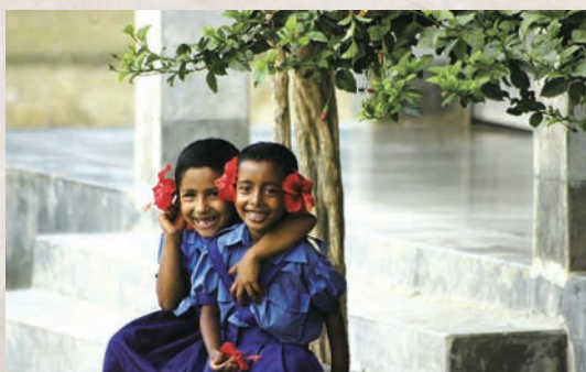
ベンガルの村の子どもたち

百年前の とある日に いまから百年後に 君の家（うち）で、歌って聞かせる新しい詩人は誰か？ 今日の春の歓喜（よろこび）の挨拶を、わたしは その人に送る。 わたしの春の歌が、しばし君の春の日に こだましますように。 君の心臓（こころ）の鼓動のなかに、若い蜂たちのうなりのなかに、 そして、木の葉のざわめきのなかにも、こだましますように。