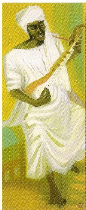
秋野不矩「唄うバウル(吟遊詩人)」1984年 佐久市立近代美術館(後期展示)