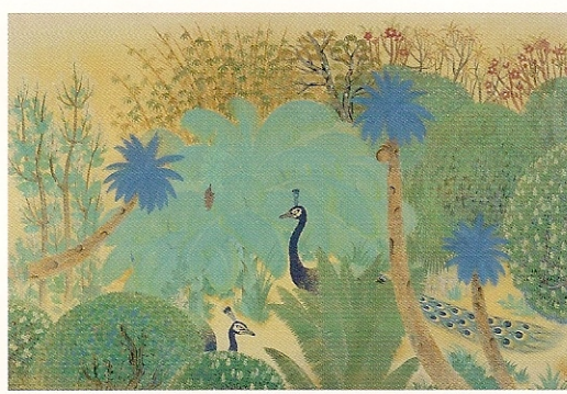
荒井寛方「薫風」1919年 再興第6回院展出品 さくら市ミュージアム-荒井寛方記念館-