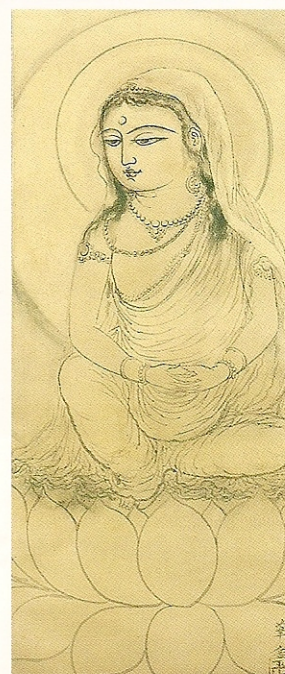
村上華岳「観世音菩薩図」(部分) 1932年 茨城県近代美術館(前期展示)