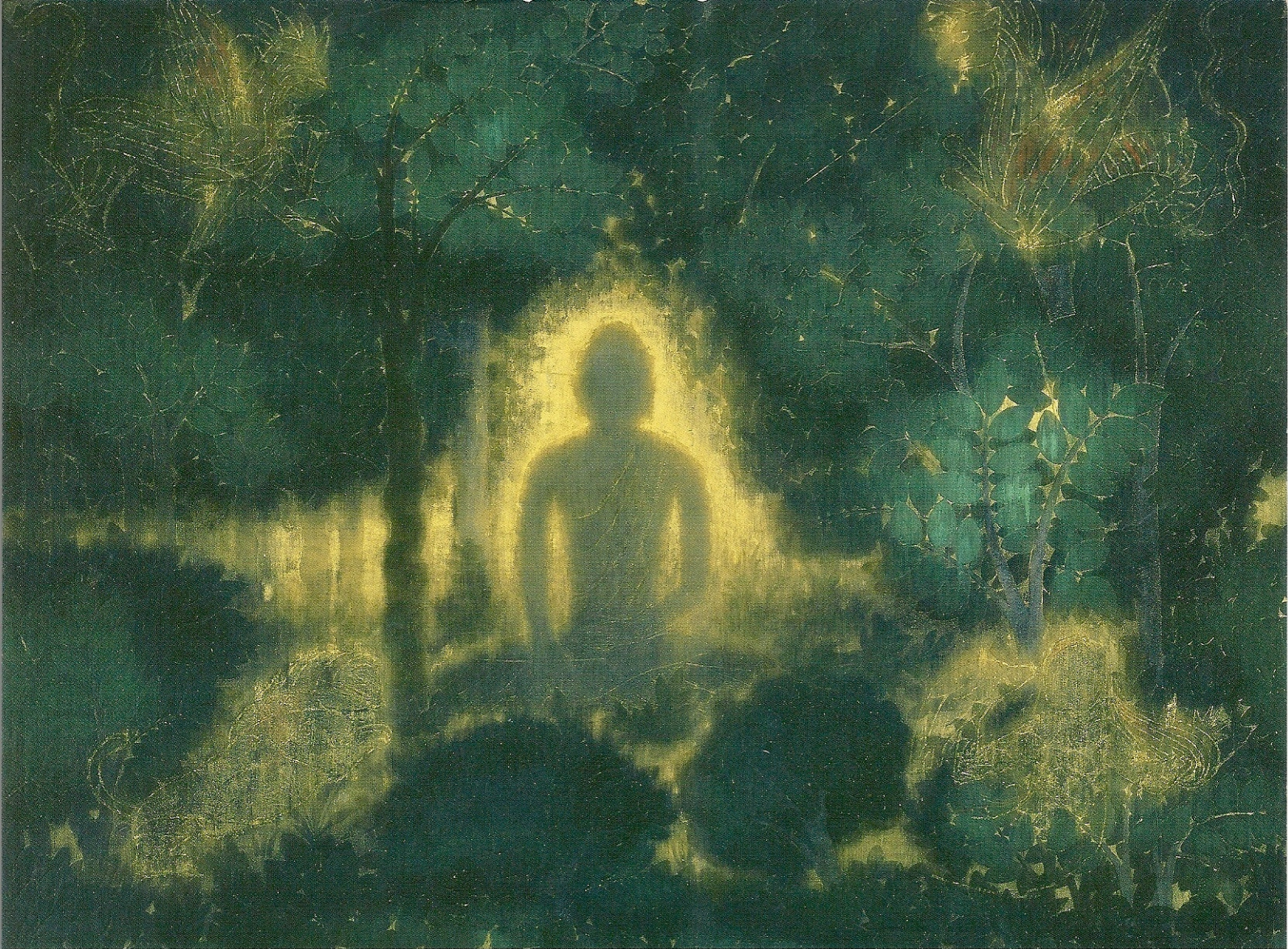
平山郁夫「建立金剛心図」1963年 東京国立近代美術館 再興第48回院展（前期展示）